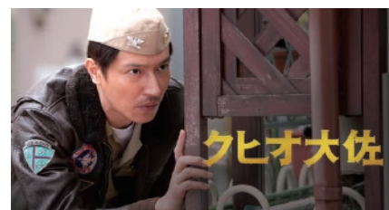
映画「クヒオ大佐」 主演 堺雅人さんの付け鼻メイクを担当